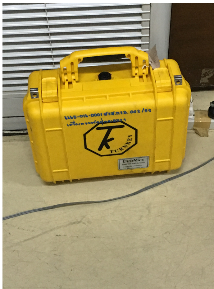
รูปเครื่องมือต่างๆที่ใช้ในการทดสอบ