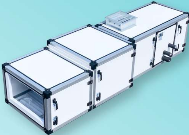
STRONG & DURABLE