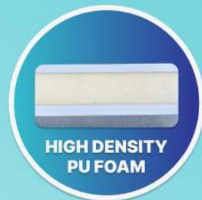
HIGH DENSITY PU FOAM